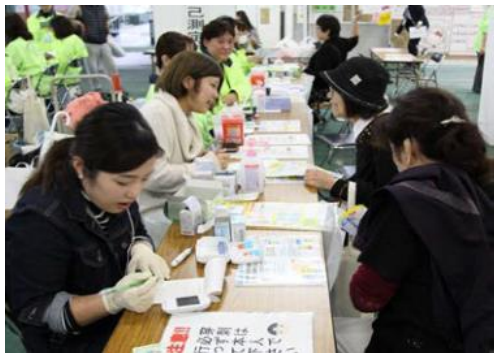
昨年度の様子(自己血糖測定、糖尿病相談)

会場3か所をまわる「健康スタンプラリー」に参加すると、先着1000名に景品をプレゼント！