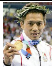
野村 忠宏 さん