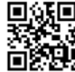
学会ホームページQRコード

※入場規制については久留米シティプラザの規定に準じます。感染対策も十分行った上での入場と致します。検温など行い，風邪症状が認められる場合は入場をご遠慮いただくこともあります。ご注意ください。