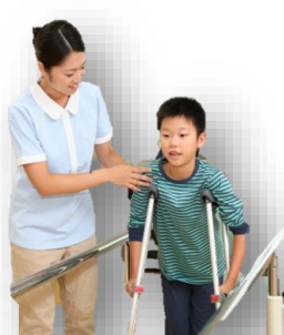
身体の健康を取り戻すためのリハビリ