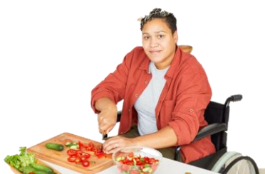
日常生活ができるようになる ためのリハビリ