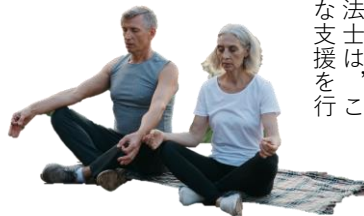
心の健康を取り戻すためのリハビリ