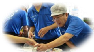
作業療法によって、 お仕事に復帰できた

作業療法士は、人々がより充実した生活を送るためのサポートをする専門家です。病気や怪我、事故や災害など様々な理由によって、生活のしづらさを抱えた人々に対応します。日常生活や仕事などに必要な活動が、できるだけ一人で楽に取り組めるように支援します。そのために、朝起きてから寝るまでの身の回りの動作の獲得や認知能力の改善、環境の調整を通じて、心身の健康を促進します。作業療法士は、対象者の「こうしたい」「こうなりたい」を叶えるため、再び自分らしい人生を歩むお手伝いを隣に寄り添いサポートする仕事です。